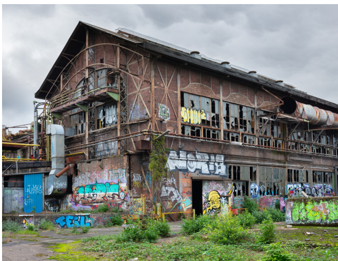
Denkmalgeschützte Möhringhalle aus dem Jahre 1902

Ein unmittelbarer Erwerb durch die Stadt Köln ist aufgrund haushaltsrechtlicher Vorgaben des Landes NRW nicht möglich. Das Verkaufsverfahren wird von der Eigentümerin unter Beteiligung der Stadt Köln durchgeführt. Das in den Verkauf integrierte sogenannte Qualifizierungsverfahren bildet die Grundlage für die weitere Bauleitplanung im Otto-Langen-Quartier.