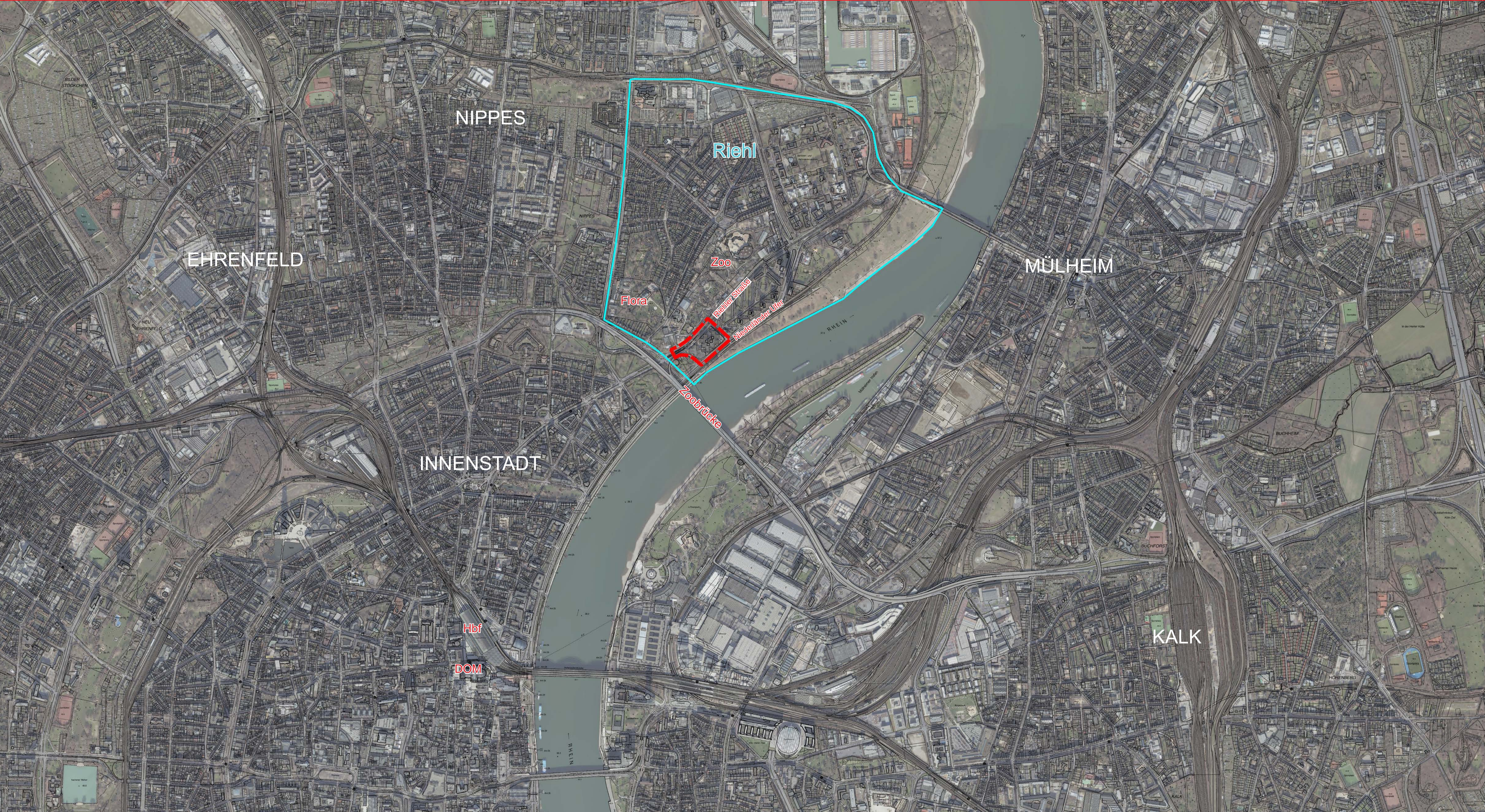
Lage im Raum (Kartengrundlage: Land NRW, 2025)