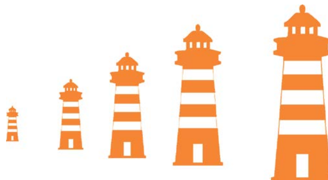
Abbildung 4: Priorisierung