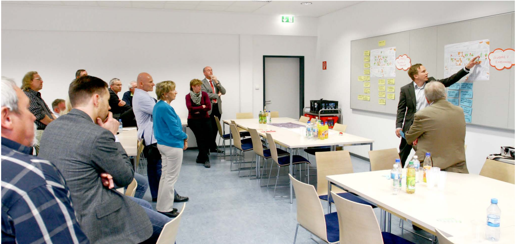
Abbildung 2: Beispiel Thementisch