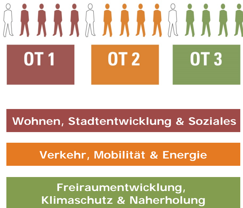
Abbildung 3: Übersicht der Thementische