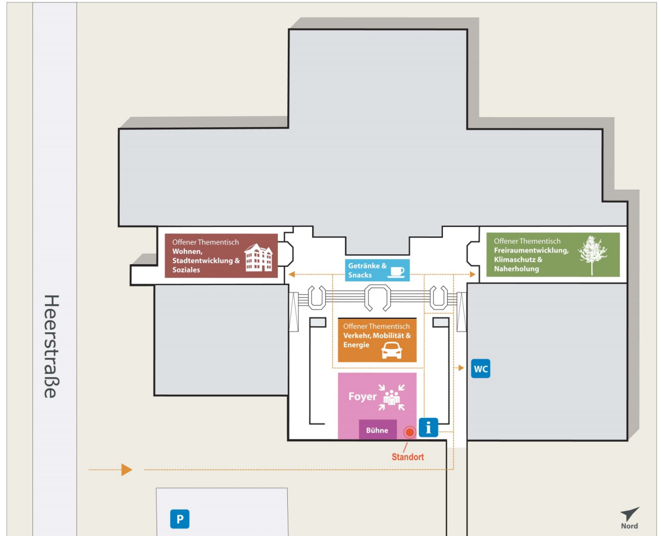
Abbildung 5: Lageplan Schulzentrum Zündorf