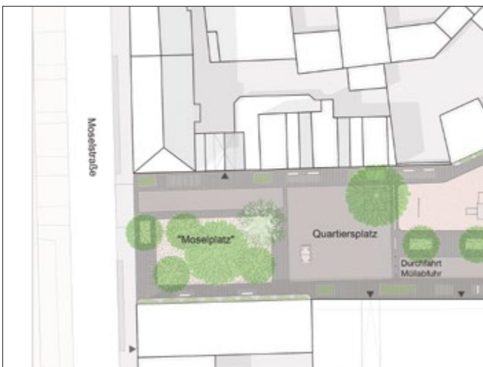
Zwischenstand des freiraumplanerischen Konzeptes

Auf dem angrenzenden Grundstück soll durch eine geplante Baulückenschließung neuer Wohnraum im öffentlich geförderten Wohnungsbau entstehen. Die sich daraus ergebene Möglichkeit soll genutzt werden, das Plangebiet den Bewohnerinnen und Bewohner des Quartiers öffentlich zugänglich zu machen und Wohnumfeldqualitäten für das Quartier zu schaffen. Ziel ist, gemeinsam mit den Bewohnerinnen und