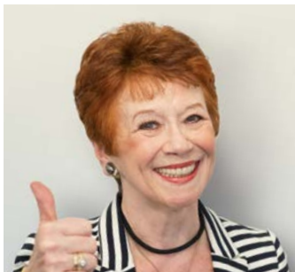
L'actrice Lotti Krekel