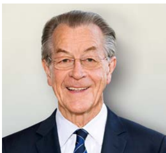
Président du BAGSO e.V. Franz Müntefering