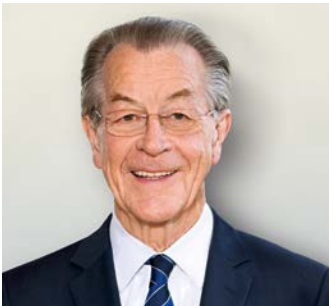
Presidente BAGSO e. V. Franz Müntefering