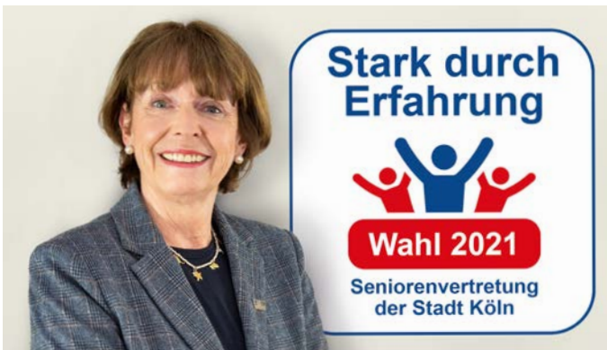
Alcaldesa Henriette Reker