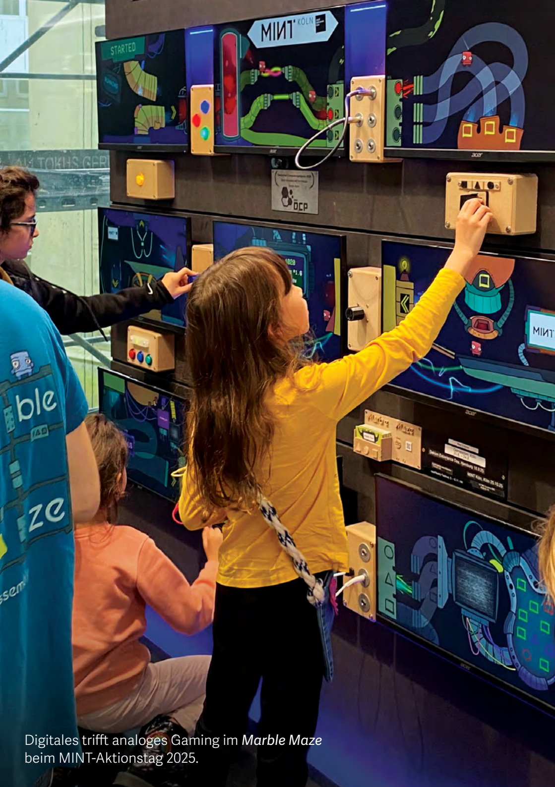
Digitales trifft analoges Gaming im Marble Maze beim MINT-Aktionstag 2025.