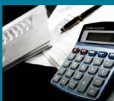
AKTUELLE BILDUNGSGÄNGE BEISPIELHAFT

Die Bildungsgänge an Berufskollegs ermöglichen alle allgemeinbildende Schulabschlüsse der Sekundarstufe I und der Sekundarstufe II. Je nach Bildungsgang ist es möglich einen höheren Abschluss zu erreichen.