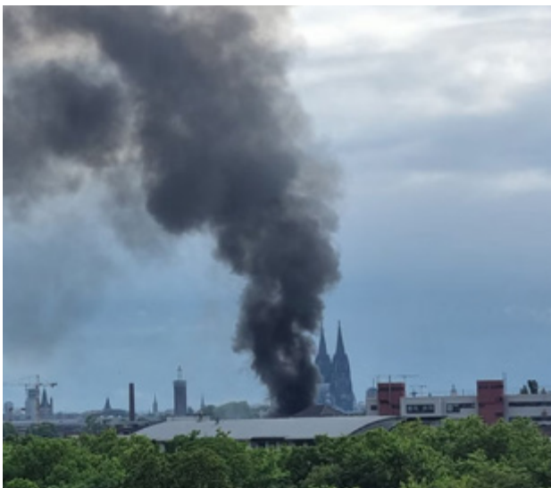
Пожежа з утворенням сильного задимлення

Це може статися, наприклад, у разі витоку небезпечної речовини, пожежі чи аварії. Крім того, у Кельні також можуть бути оповіщення про раптовий розлив Рейну або його невеликих приток. Сигнал сирени використовується як побудка для населення.