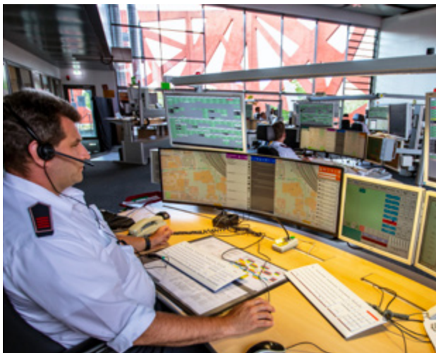
Центр управління пожежної охорони Кельна

Ця брошура пояснює значення сигналів сирени та містить рекомендації щодо відповідних дій. Вона також містить додаткові посилання на важливі номери телефонів, місцеві радіостанції або інформаційний сайт міста, якими ви можете скористатися для отримання додаткової інформації.