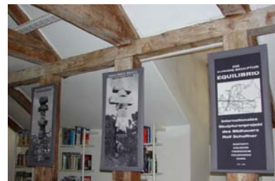
Abbildung 4: Die Ausstellung zum Symposium