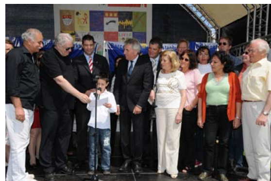
Abbildung 2: Eröffnung des Nachbarschaftstages, vielsprachig und generationenübergreifend