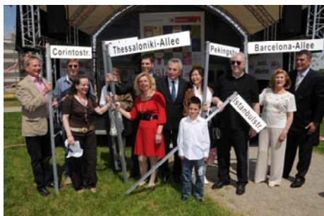
Abbildung 1: Neue Schilder für neue Straßen

Am 29. Mai 2010 feierte die Stadt Köln gemeinsam mit der GAG Immobilien Aktiengesellschaft Köln im Bürgerpark Köln-Kalk den Europäischen Nachbarschaftstag.