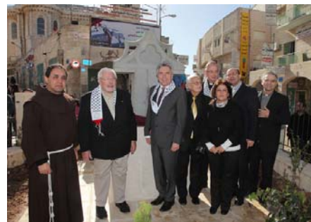
Abbildung 5: Feierliche Enthüllung des Domsteins auf dem Madbasseh-Platz

Unmittelbarer Anlass der Delegationsreise war die feierliche Einweihung eines Erweiterungsbaus des Caritas Babyhospitals in Bethlehem sowie die Einweihung eines Steins des Kölner Doms auf dem Madbasseh-Platz in der Bethlehemer Altstadt. Ein erster, 1999 aufgestellter Stein war während der zweiten Intifada von israelischen Panzern zerstört worden. Zudem überreichten Roters und Giesen-Weirich bei ihrem Aufenthalt in Bethlehem symbolische Spendenchecks über jeweils 30.000 Euro an das Caritas Babyhospital und das "Guidance and Training Center" (GTC). Im GTC werden vorrangig traumatisierte Kinder und Jugendliche behandelt.