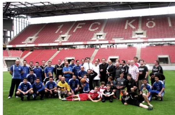
Abbildung 14: Vor dem Anpfiff - Das Gruppenfoto mit den Ehrengästen