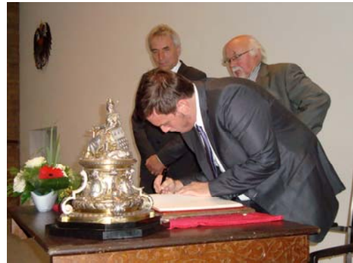
Abbildung 15: Die Ehrengäste des Festaktes tragen sich ins Gästebuch der Stadt Köln ein