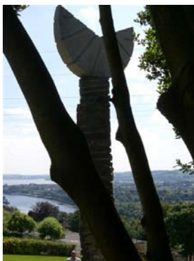
Abbildung 3: Equilibrio-Steale West in Cork