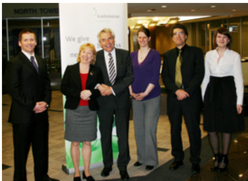
Abbildung 7: Oberbürgermeister Jürgen Roters (3.v.l.) mit Vertreterinnen und Vertretern der Koelnmesse GmbH sowie Frieder Wolf, Leiter des Büros für Internationale Angelegenheiten

Die seit 1988 bestehende Städtepartnerschaft mit Indianapolis ist ebenso ein Bekenntnis zur deutsch-amerikanischen Freundschaft wie das städtische Engagement im Amerika Haus Nordrhein-Westfalen e. V. Oberbürgermeister Jürgen Roters nutzte seinen Aufenthalt in den USA anlässlich der UCLG-Generalversammlung (siehe Seite 18) deshalb auch, um die guten transatlantischen Beziehungen auf kommunaler Ebene zu pflegen.