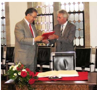
Abbildung 13: Oberbürgermeister Ahmed Aboutaleb (links) nimmt von seinem Kölner Amtskollegen eine Erinnerung an den Besuch in der Domstadt in Empfang