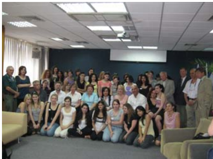
Abbildung 6: Schülerinnen aus Köln, Bethlehem und Tel Aviv beim Empfang im Rathaus der Stadt Tel Aviv

Im Rahmen des trilateralen Austauschs zwischen dem Heinrich-Heine Gymnasium, Köln, der Irony Hey High School, Tel Aviv, und Talitha Kumi, Bethlehem, reisten Kölner Schülerinnen im März 2010 für eine Woche in die beiden Partnerstädte. 2009 hatten sich die Schülerinnen erstmals in Köln getroffen.