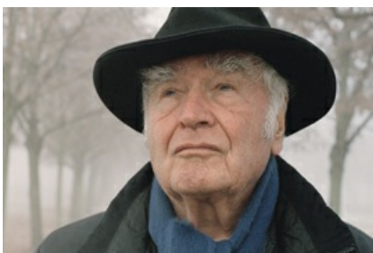
Martin Walser

Das Literaturfestival lit.COLOGNE ist eine der herausragenden, publikumsstarken Kulturveranstaltungen in Köln. 192 Veranstaltungen laden vom 8. bis 16. März zu Lesungen, Themenabenden, einem Kinderprogramm und interessanten Begegnungen ein.