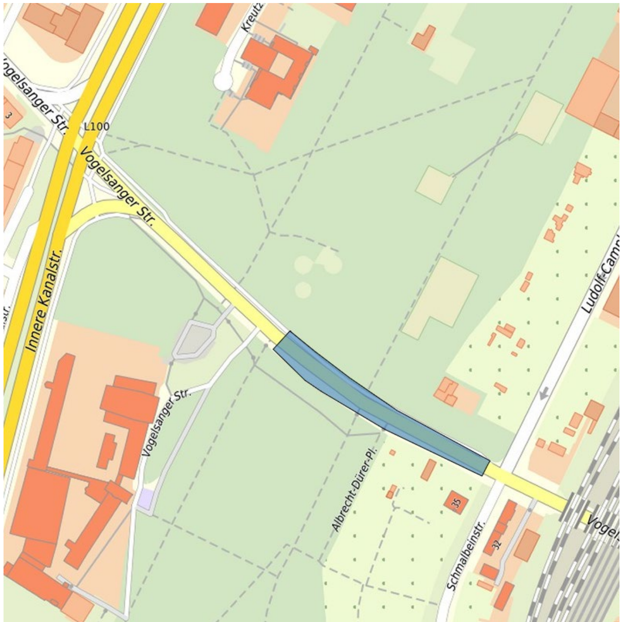
Abbildung 1: Flächenskizze Pop-up-Angebot Vogelsanger Straße