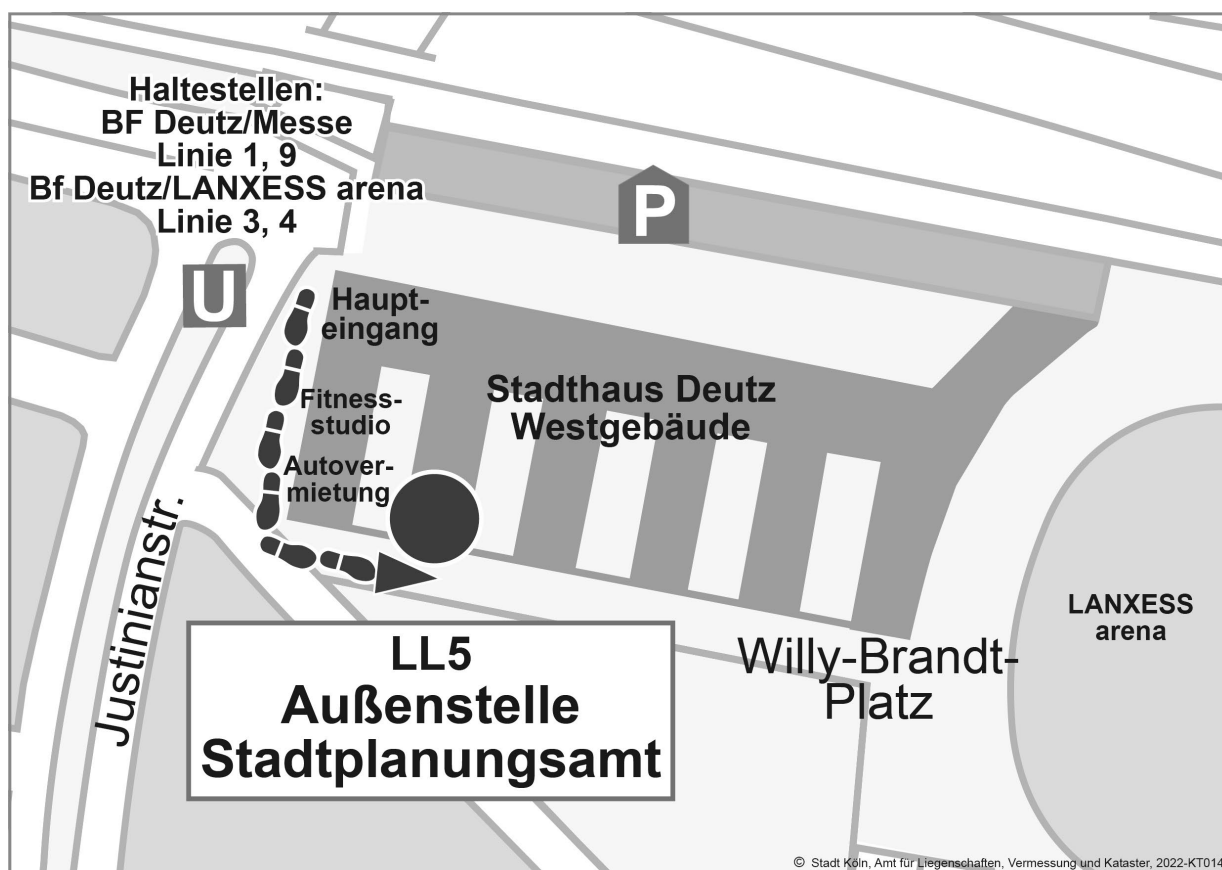
Abbildung 3: Lageplan zur Außenstelle des Stadtplanungsamtes