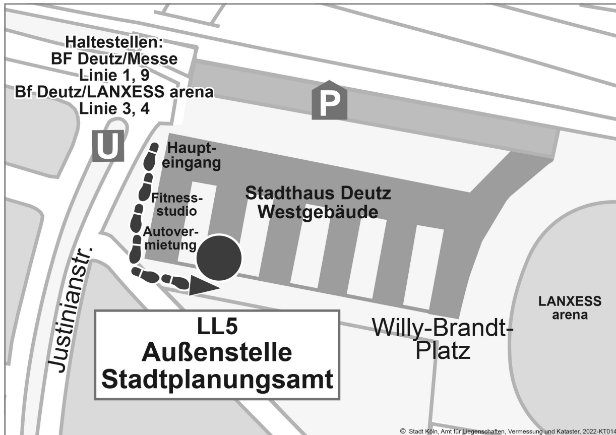
Abbildung 2: Lageplan der Außenstelle des Stadtplanungsamtes