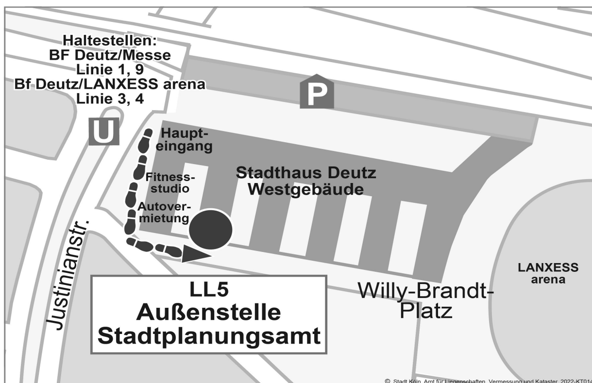
Abbildung 2: Lageplan der Außenstelle des Stadtplanungsamts