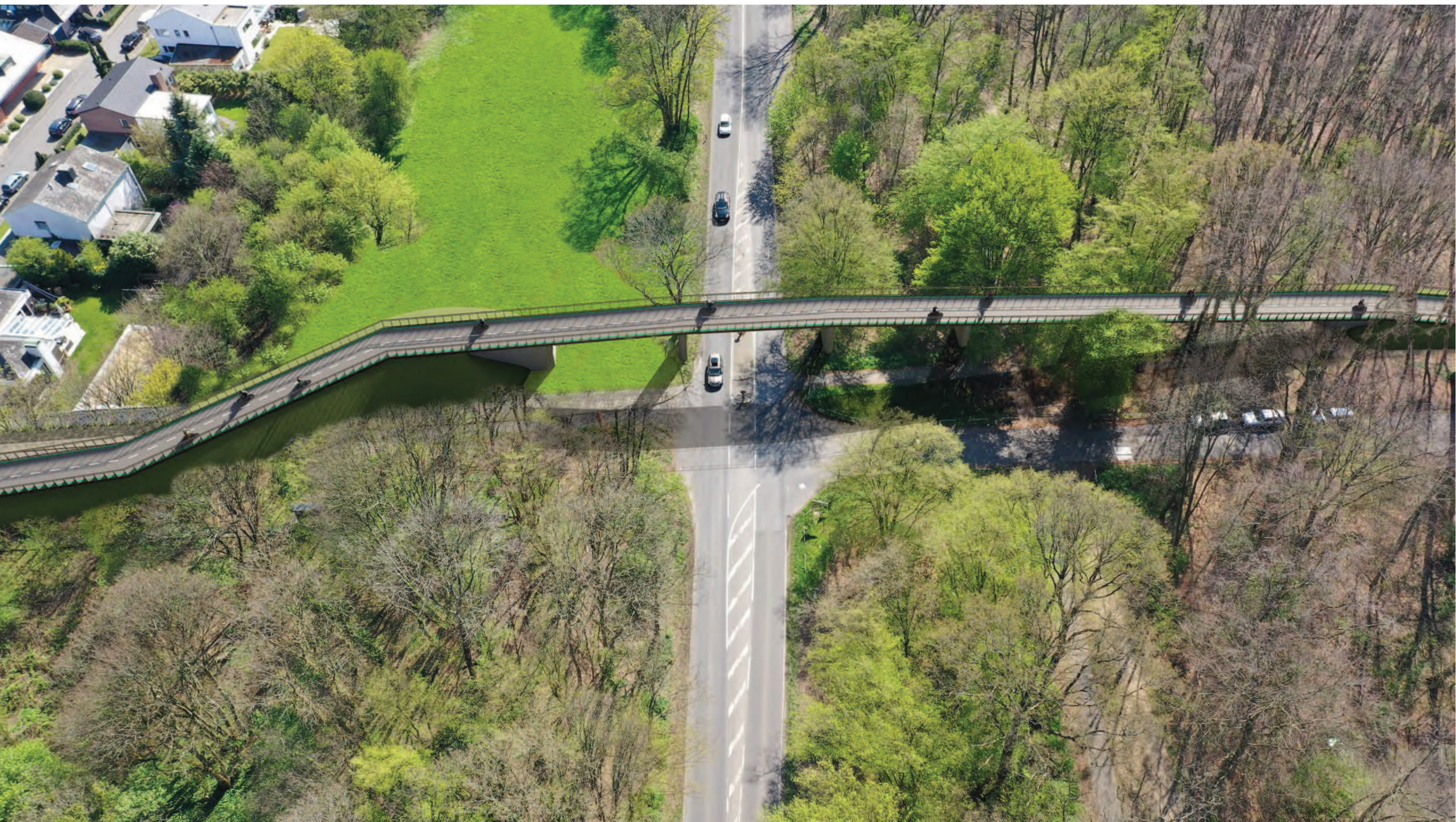
Abschnitt 2 - Querung Militärringstraße, Variante Überführung