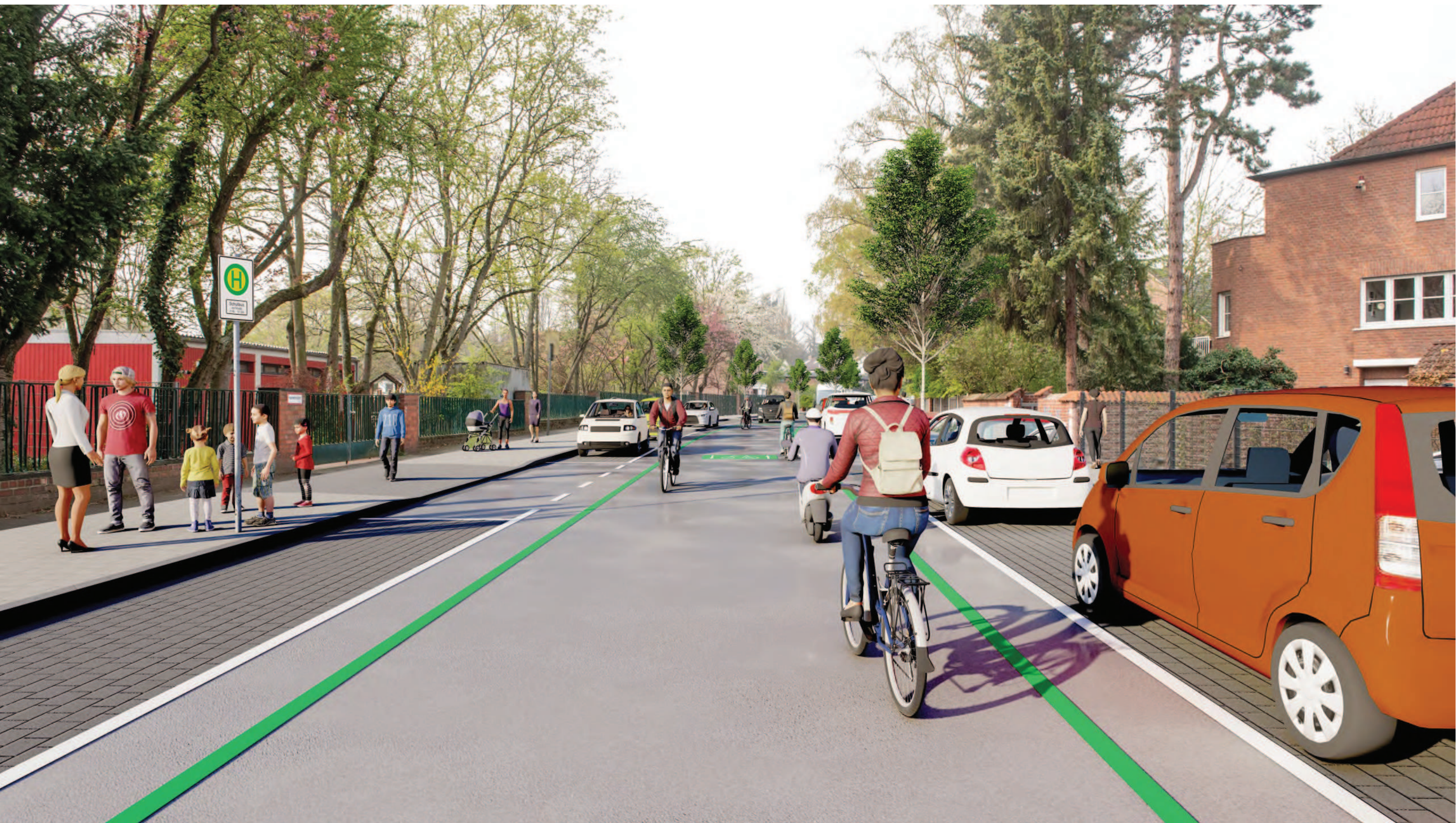
Abschnitt 1 - Bachemer Straße Höhe GGS Freiligrathstraße, Vorzugsvariante (Vollausbau)