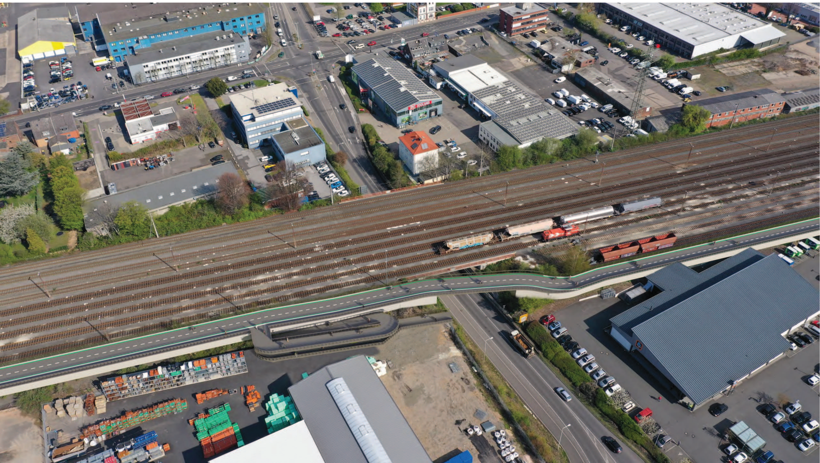
Abschnitt 4 - (Frechen) - HGK Trasse Querung Bonnstraße