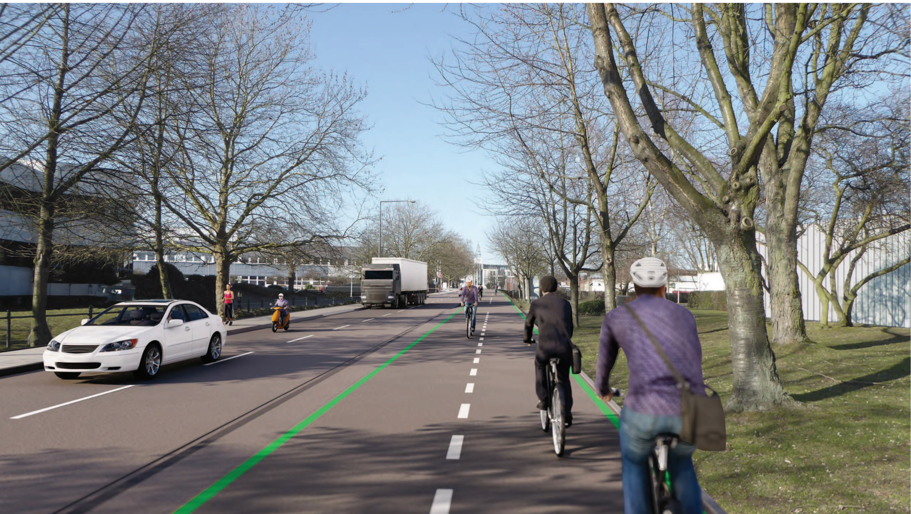
Abschnitt 3 - Toyota-Allee zwischen BAB A4 und Horbeller Straße