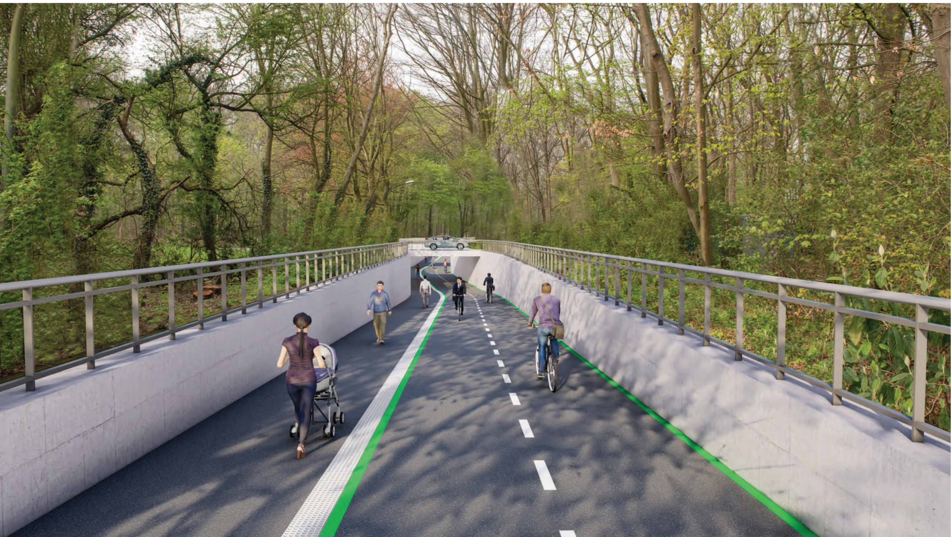
Abschnitt 2 - Querung Militärringstraße, Variante Unterführung