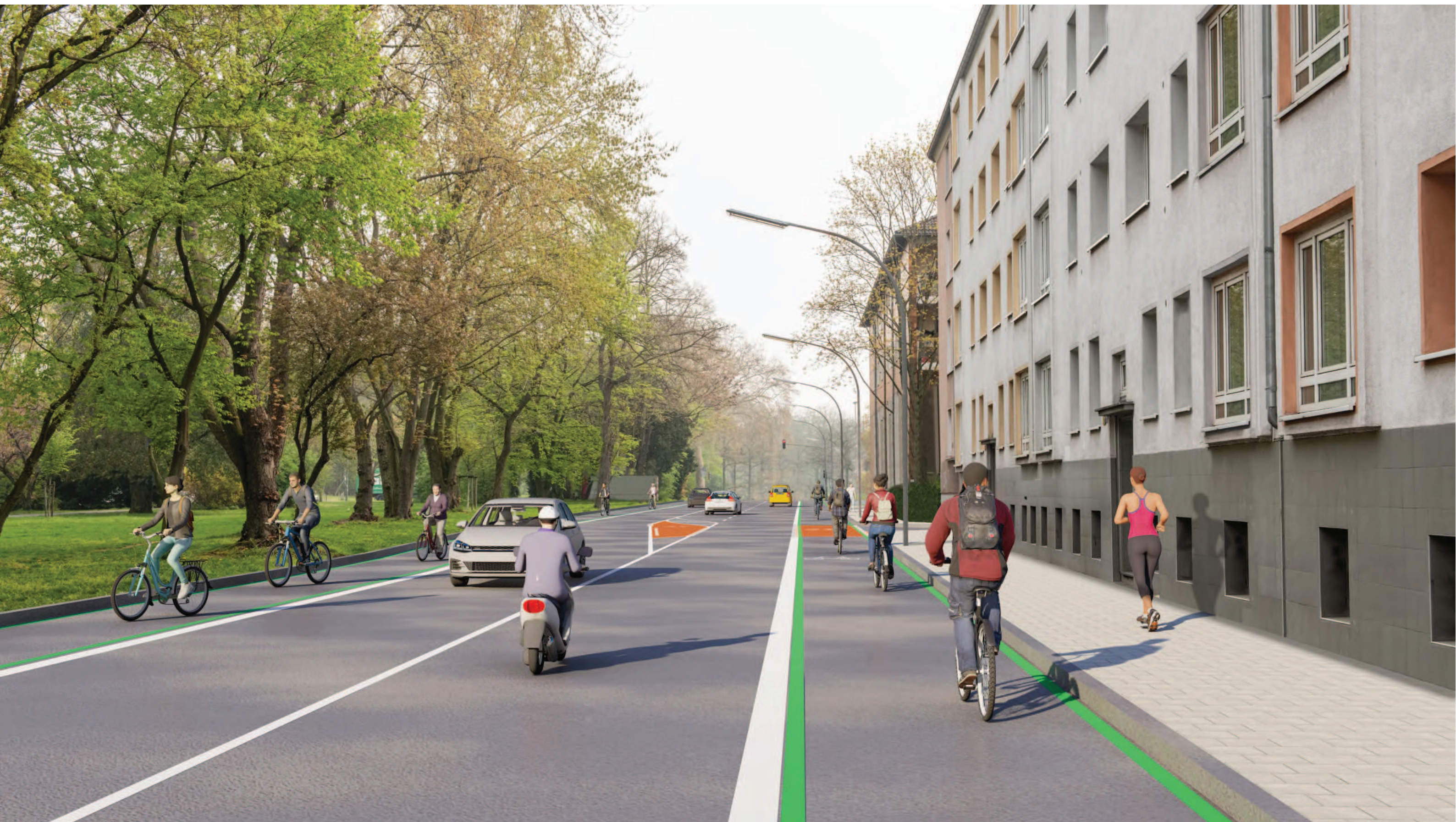
Abschnitt 1 - Bachemer Straße Bereich Universitätsstraße bis Hans-Sachs-Straße, Vorzugsvariante (1. Ausbaustufe)