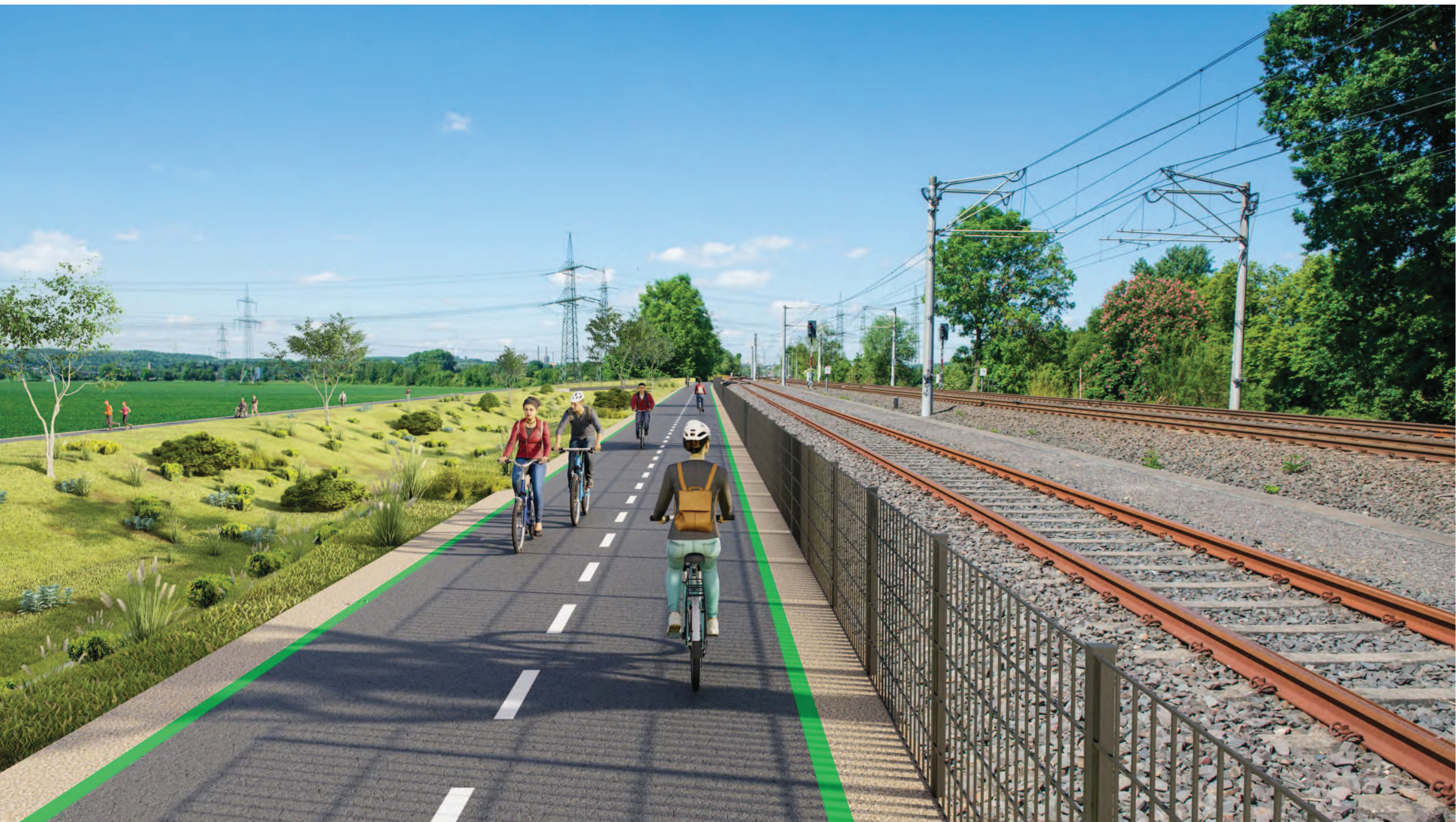
Abschnitt 4 - (Frechen) - HGK Trasse