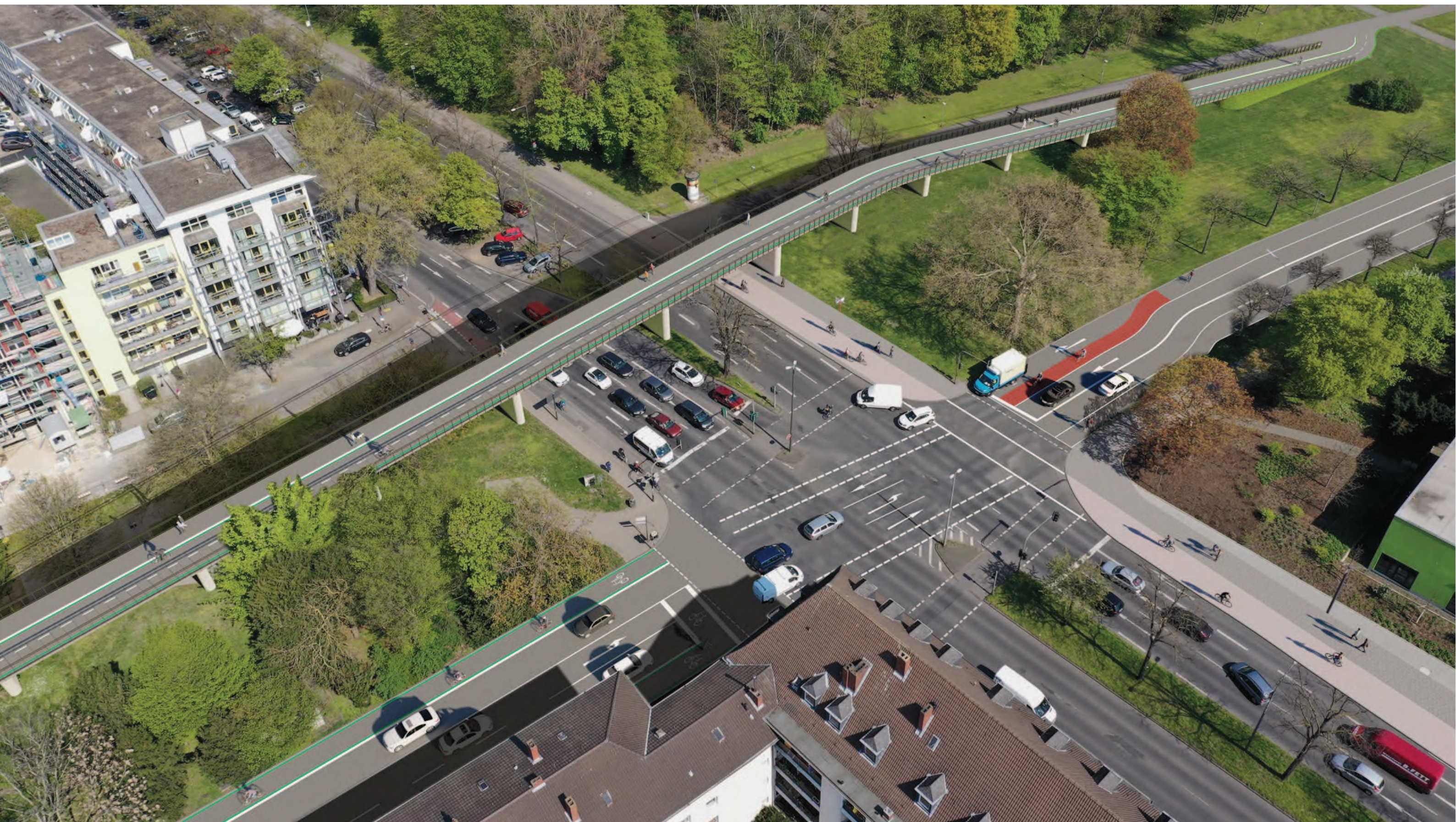
Abschnitt 1 - Knotenpunkt Universitätsstraße/Bachemer Straße, Vorzugsvariante (2. Ausbaustufe)