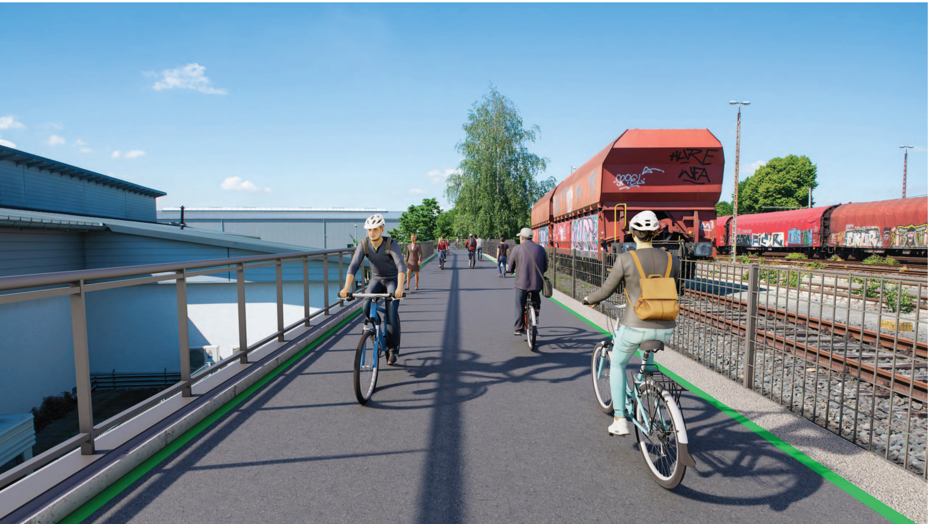
Abschnitt 4 - (Frechen) - HGK Trasse (Engstelle)