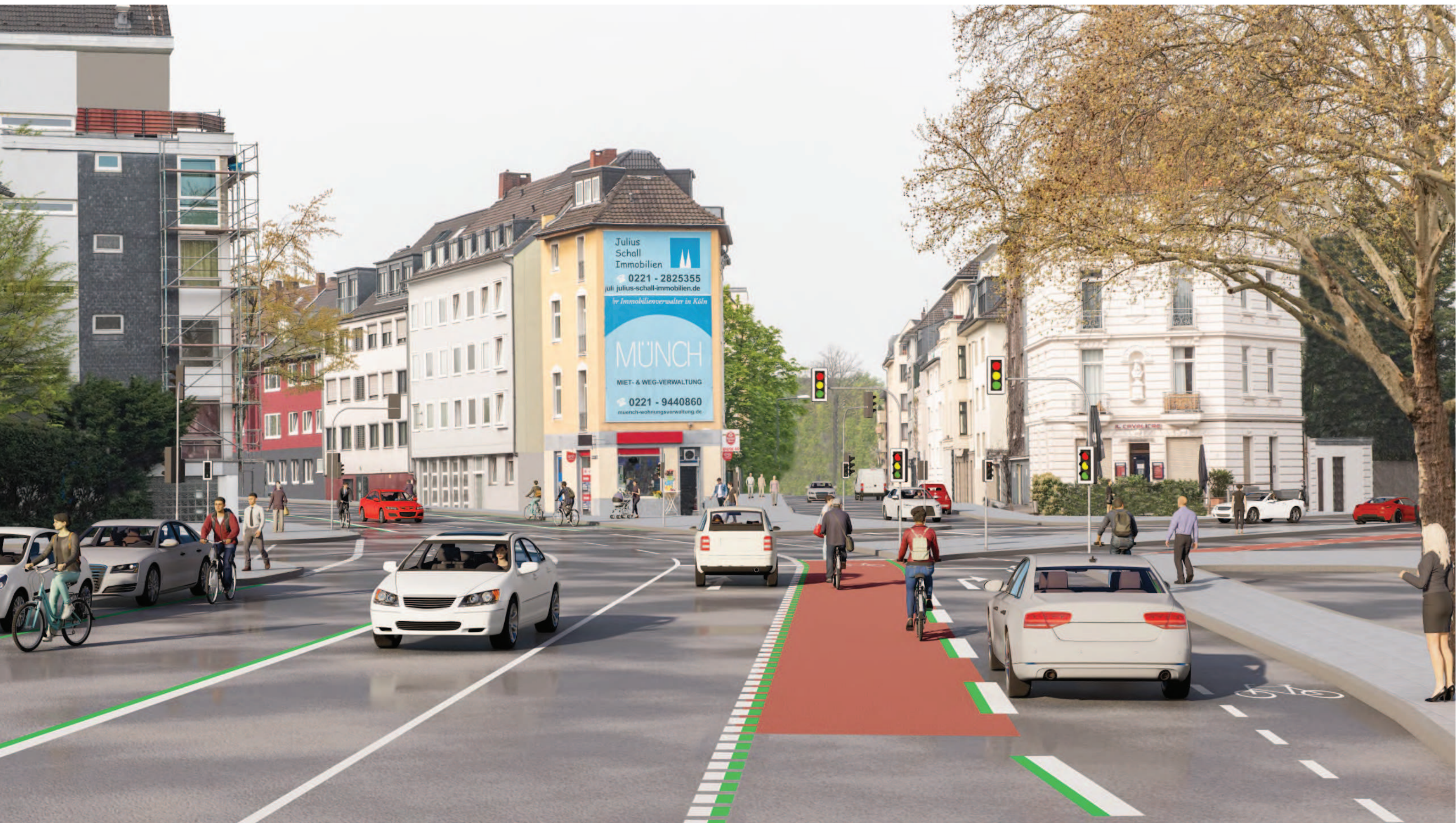
Abschnitt 1 - Knotenpunkt Bachemer Straße/Hans-Sachs-Straße, Vorzugsvariante (LSA)