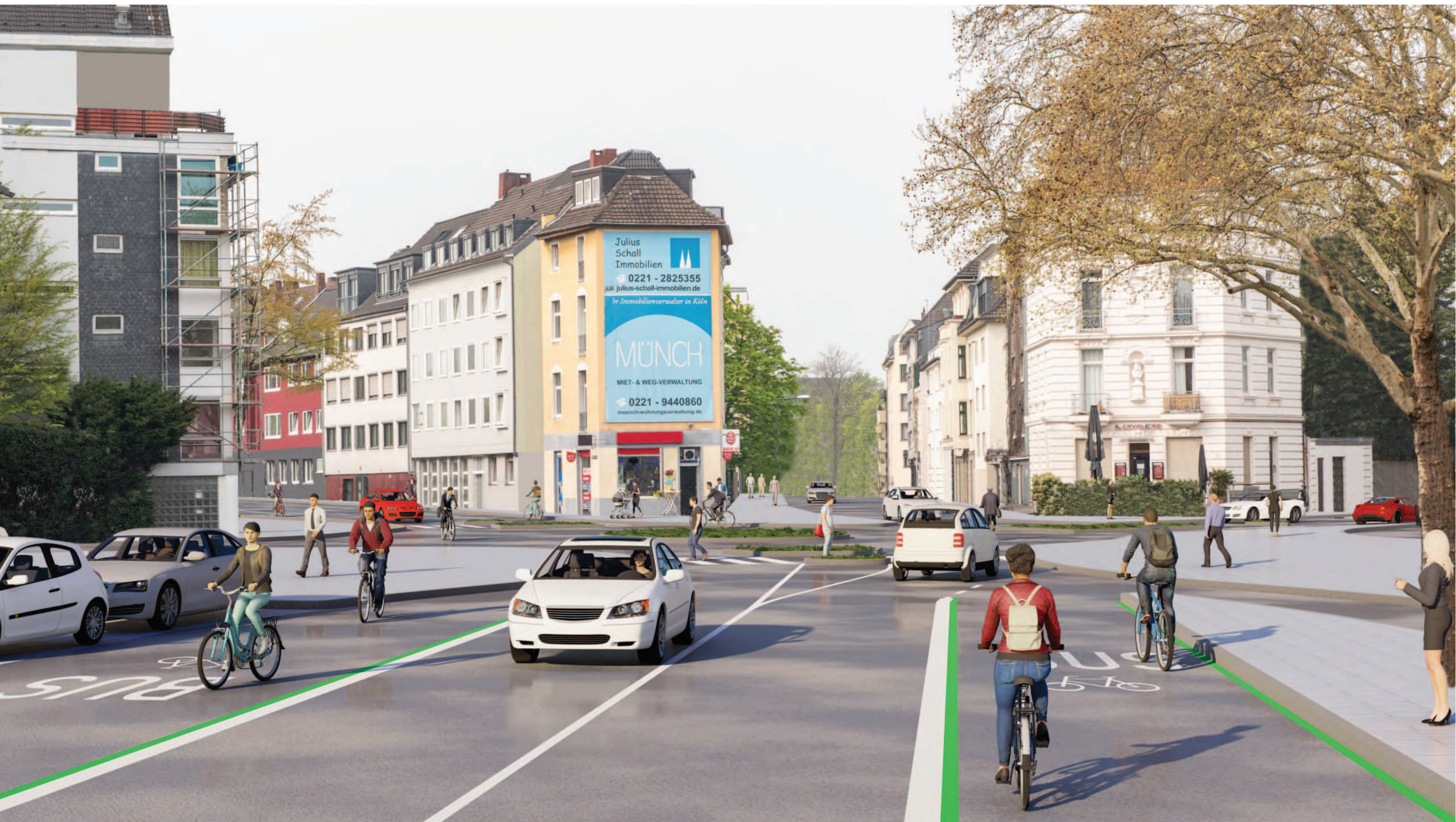
Abschnitt 1 - Knotenpunkt Bachemer Straße/Hans-Sachs-Straße, Variante Kreisverkehr