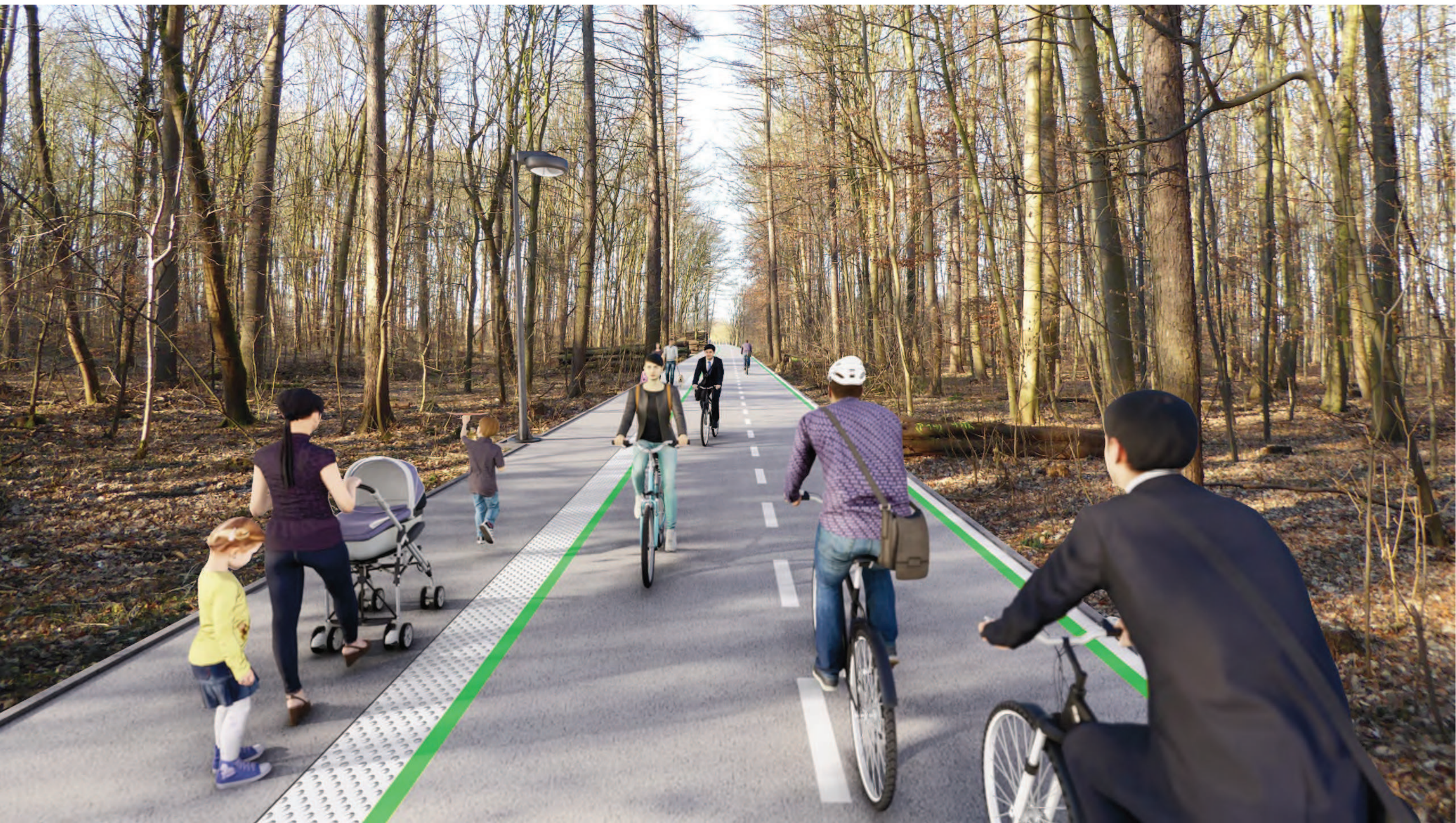
Abschnitt 2 - Grüngürtel zwischen Haus am See und BAB A4