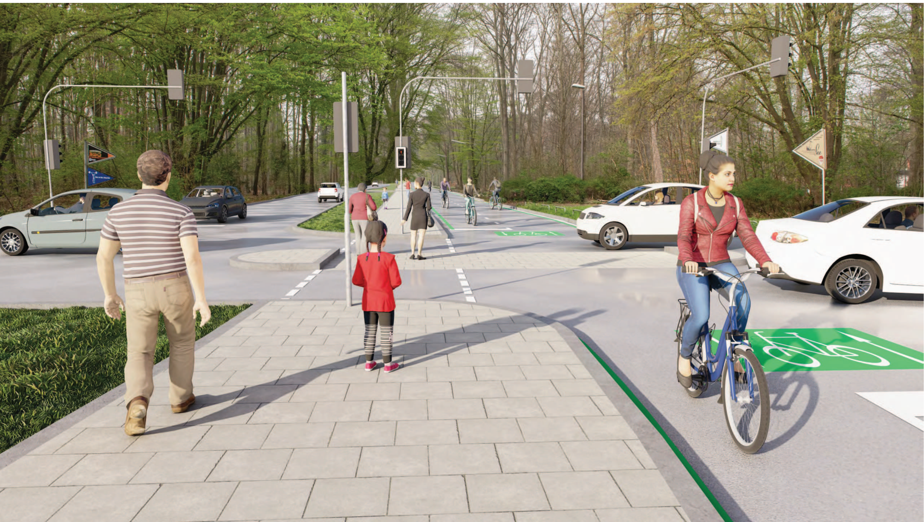
Abschnitt 2 - Querung Militärringstraße, Vorzugsvariante (LSA und getrennte Führung MIV/RV)