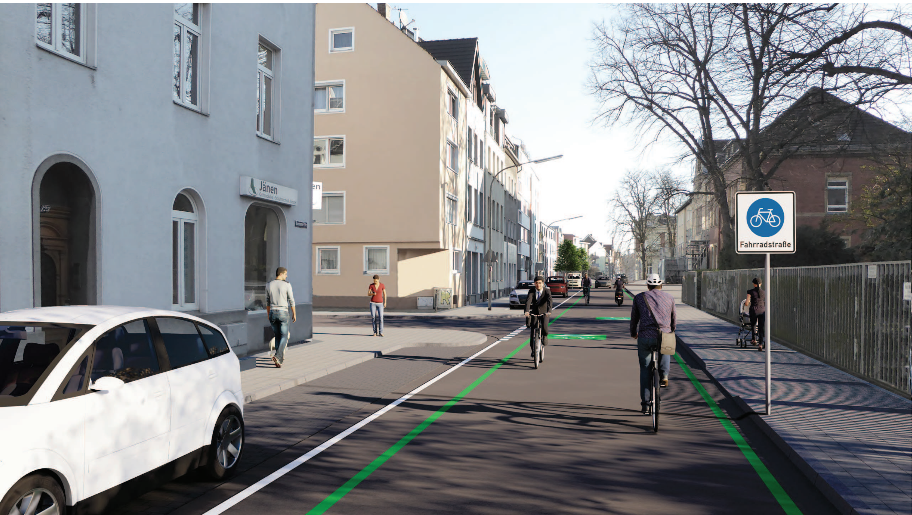
Abschnitt 1 - Bachemer Straße Höhe Wittgensteinstraße, Vorzugsvariante (Vollausbau)