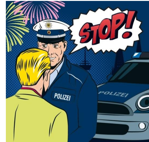
Polizei und Ordnungskräfte schreiten frühzeitig und konsequent ein