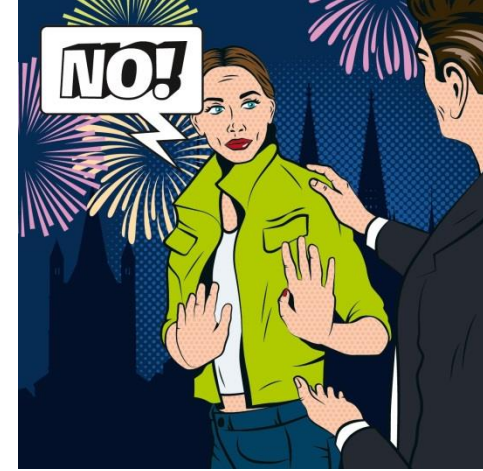
Nein heißt Nein! Null Toleranz bei Übergriffen