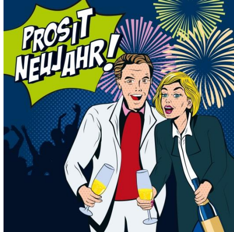
Fröhlich, sicher und respektvoll feiern