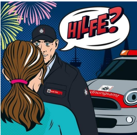
Polizei, Ordnungskräfte sind präsent