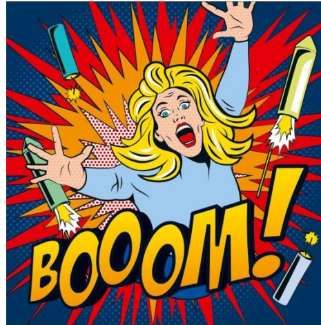
Feuerwerkskörper nicht auf Menschen abschießen