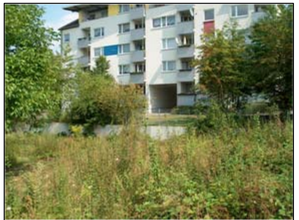
Umgebende Bebauung (östlich)