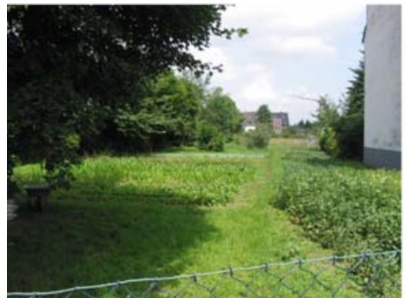
Blick in das Baugebiet