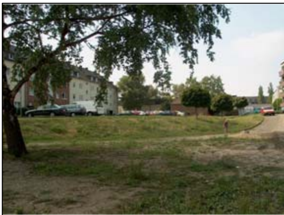
Zufahrt zur Fläche