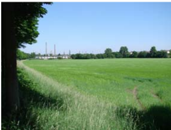
Blick in das Baugebiet