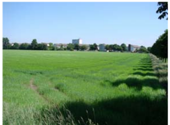
Blick in das Baugebiet